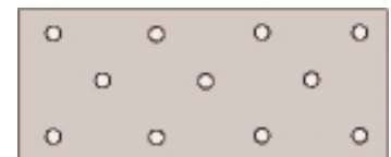
40 x 2,0/3,0 mm Ø5,0