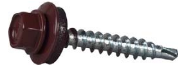
Dostępne w paletcie kolorów RAL