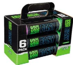
6 gab. 290 ml